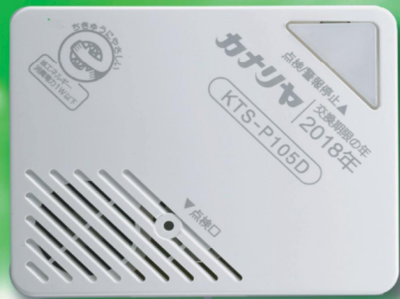
型式 KTS-P105D (コードレスタイプ)