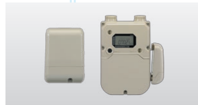
無線通信端末 (LPガス用)

LPデータクラウドサービス「ガスミエール」などのクラウドサービスとLPガスメーターを接続する機器です。メーター横や配管に設置する外付型とK-SM \alpha 本体カウンター下部にビルトイン可能な収納型があります。