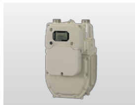
膜式スマートメーター 業務用4号、6号

LPガス用膜式スマートメーターです。IoT社会のさまざまな「つなぐ×ひろがる」の世界を創ってまいります。収納型無線通信端末を本体カウンター下にビルトインすることも可能です。