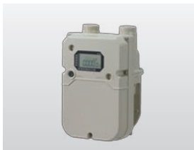
膜式スマートメーター