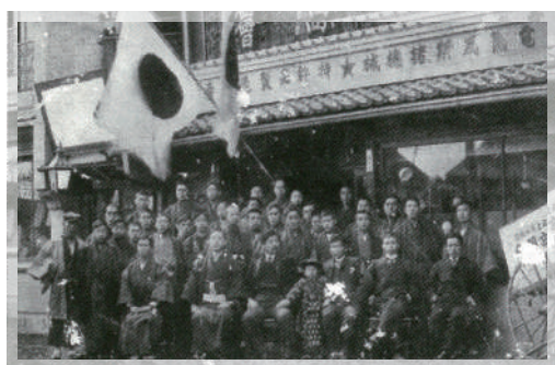
創設当初の金門商会