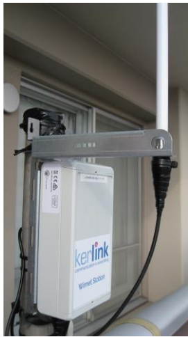
ゲートウェイ（菱電商事株式会社提供）